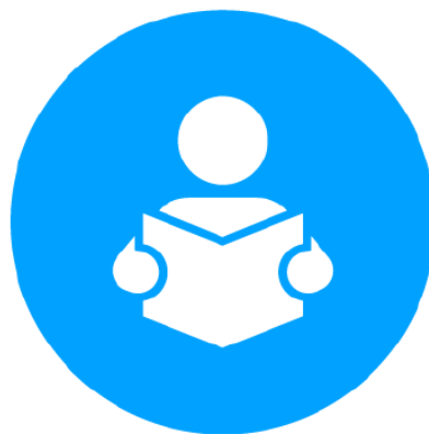
LER/VER UM LIVRO